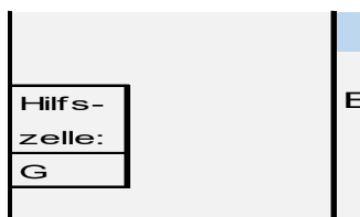
Abbildung 7: Ansicht „Hilfszeile G“

In den Abfrageblöcken gibt es in der rechten Spalte eine Hilfszeile G, die auf keinen Fall gelöscht werden darf. Dahinter verbirgt sich eine Formel, sobald diese gelöscht wird ist die Funktionsweise der Berechnung nicht mehr gegeben.